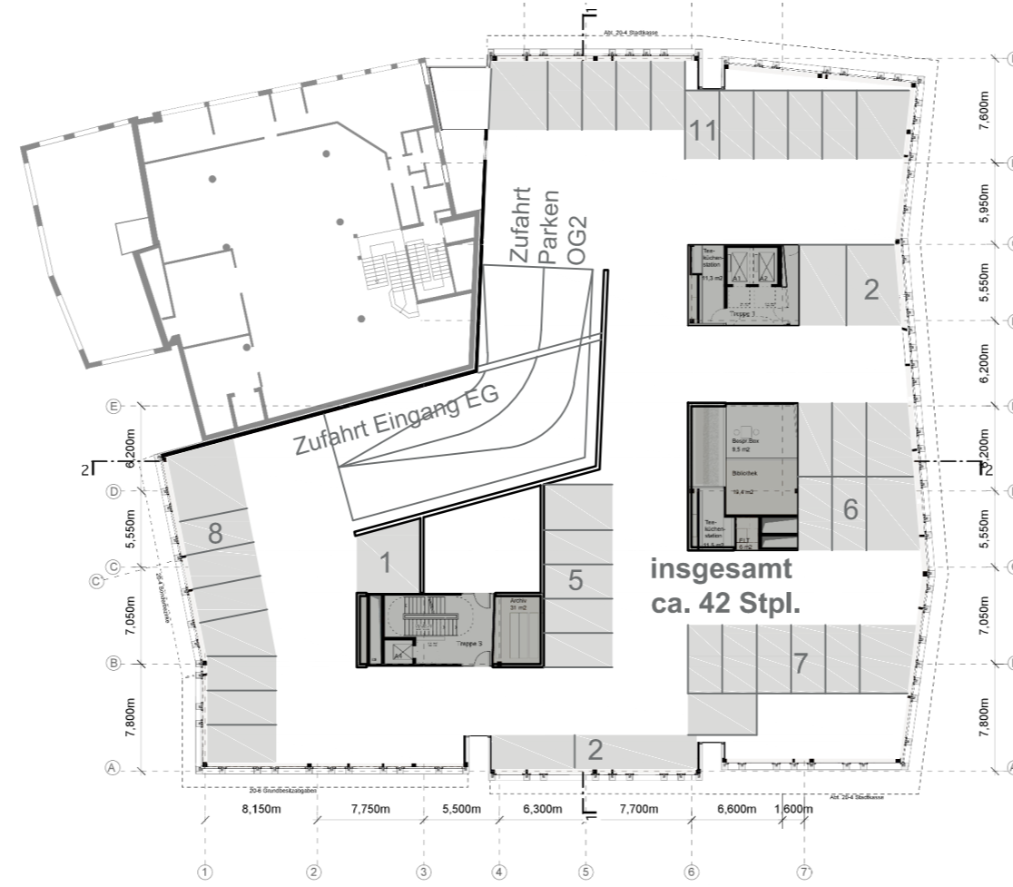
+1 OBERGESCHOSS Parken