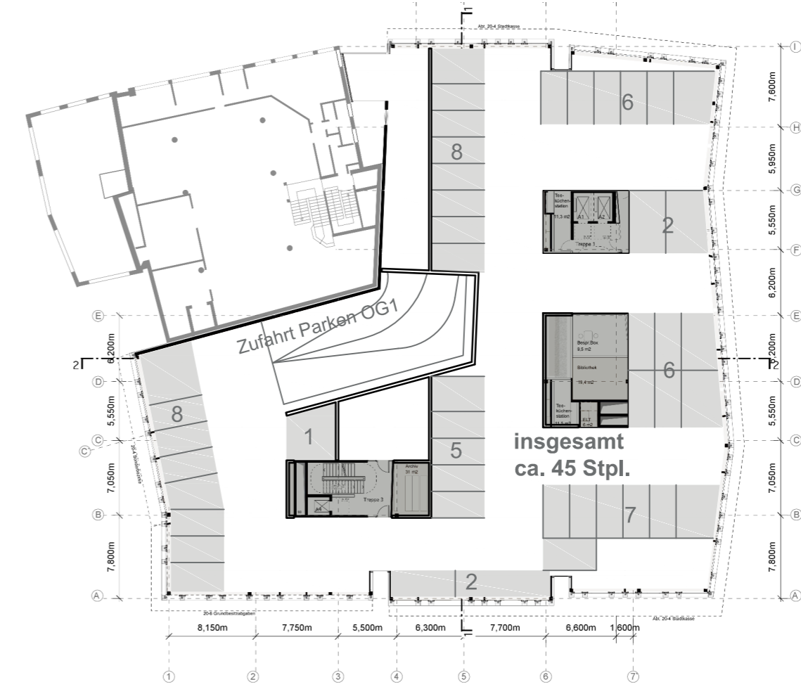
+2 OBERGESCHOSS Parken