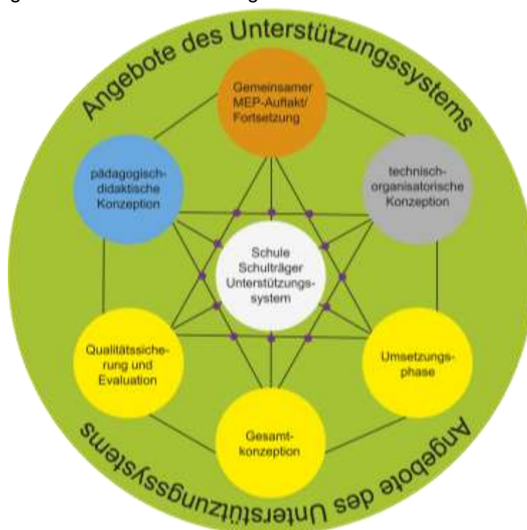
Abbildung 2: Perspektiven des MEP-Prozesses

Einen vorläufigen Abschluss des Prozesses bildet dann die Fixierung der Ergebnisse durch Schule und Schulträger. Dabei sollte auch der Prozess kritisch reflektiert werden, damit Hindernisse und Missverständnisse im weiteren Verlauf ausgeräumt und Fehler künftig vermieden werden.