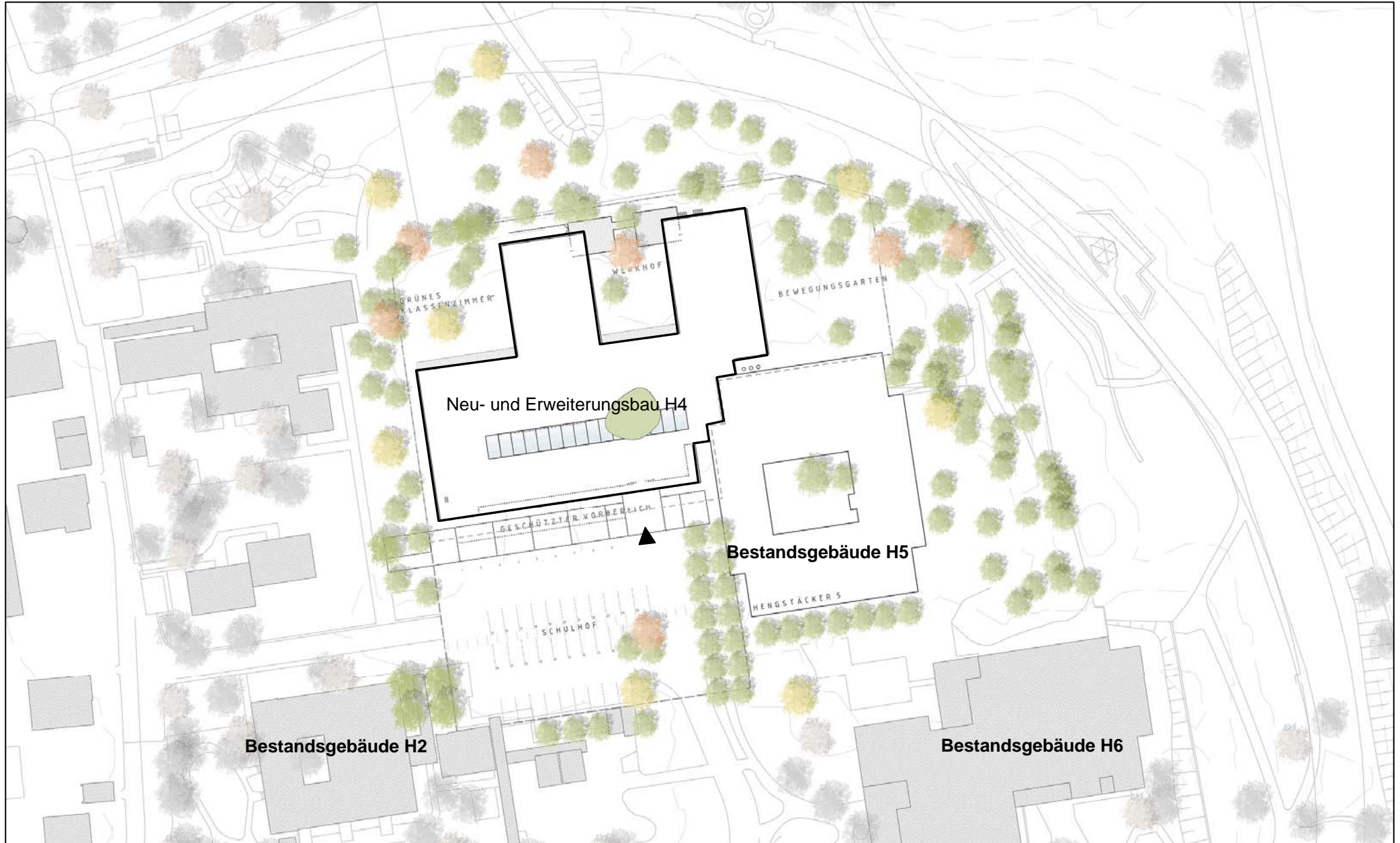
Neu- und Erweiterungsbau H4