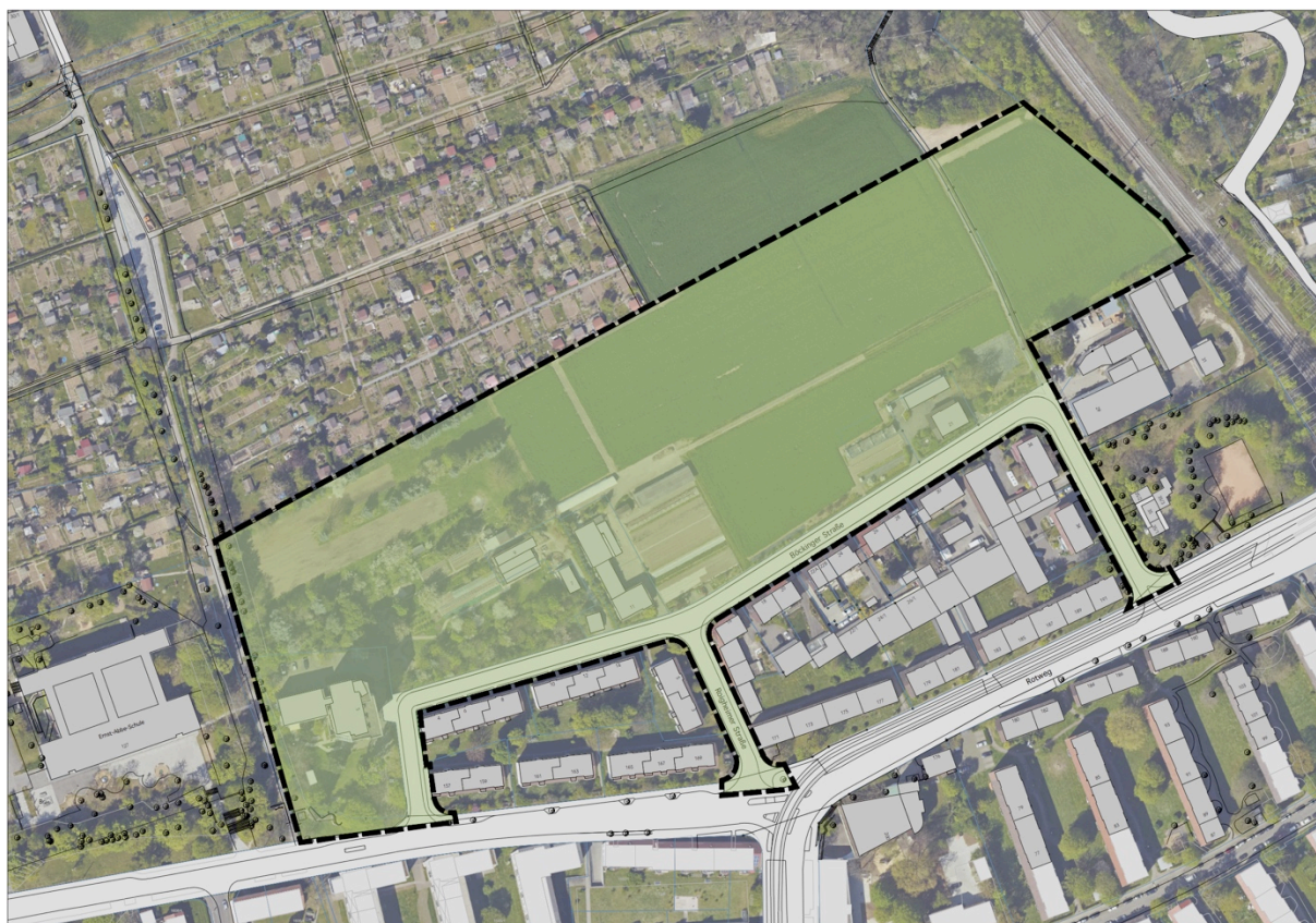
Abb.2: Luftbild mit Quartier an der Böckinger Straße

Für das Quartier sollen zudem beispielhafte Hochbauten entwickelt werden, die in ihrer zu erarbeitenden Detaillierung in einen Realisierungsteil und drei Ideenteile unterschieden werden. Diese Unterteilung dient zum einen einer möglichen Realisierbarkeit in Bauabschnitten und zum anderen soll so die Option offen bleiben, dass – je nach Empfehlungen des Preisgerichtes – mehrere Wettbewerbsteilnehmer zur Teilnahme an später folgenden, weiteren Verfahren der Ideenteile aufgefordert werden können. Somit soll eine entsprechend architektonische Vielfalt, die der Größe des Quartiers angemessen ist, ermöglicht werden.