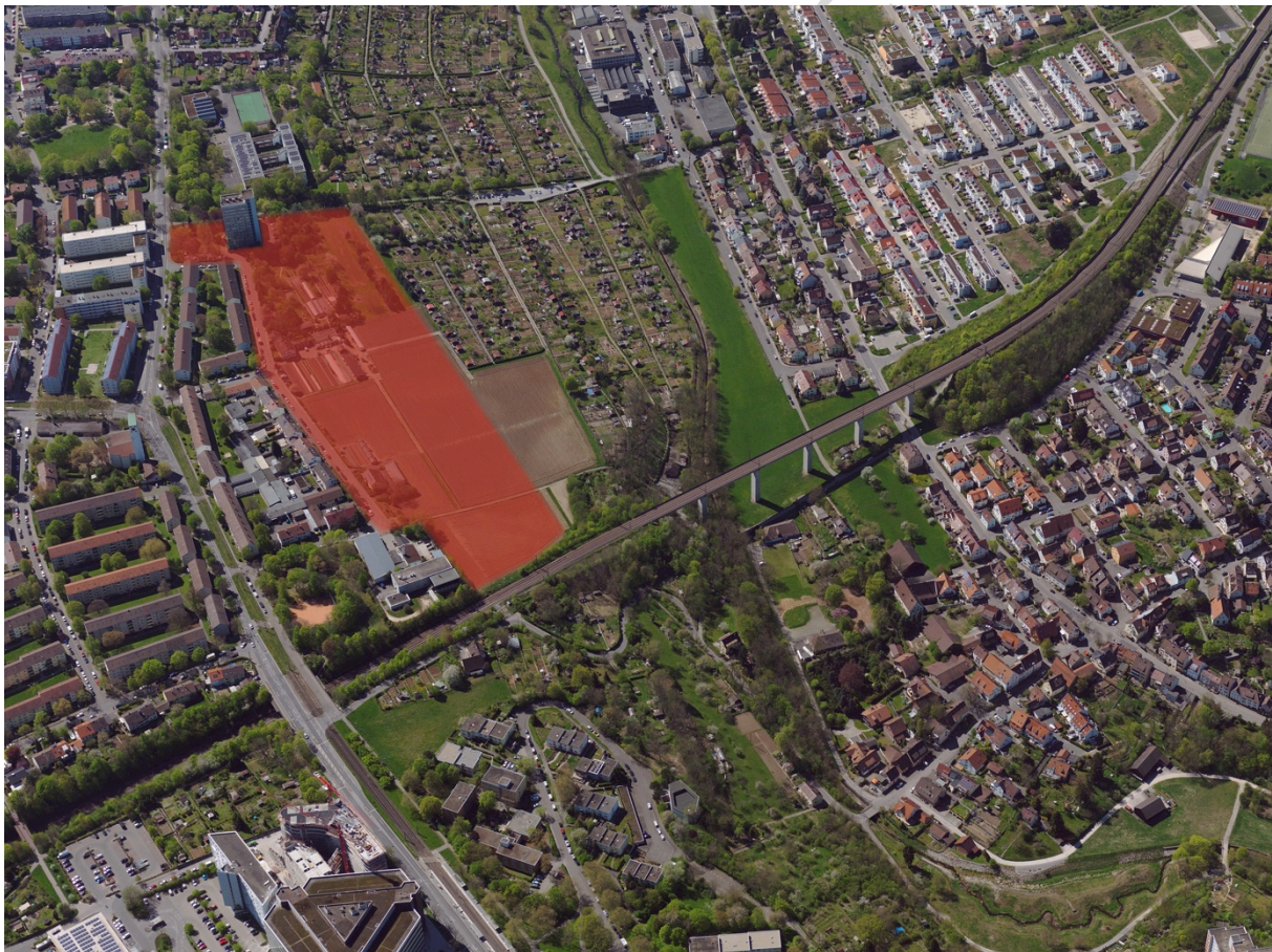
Abb.3: Schrägluftbild von Osten, Quartier an der Böckinger Straße, Quelle Landeshauptstadt Stuttgart, Stadtmessungsamt

Die Stuttgarter Wohnungs- und Städtebaugesellschaft mbH - SWSG - beabsichtigt, unter Mitwirkung der Evangelischen Gesellschaft – eva – und im Einvernehmen mit der Stadt Stuttgart, die im Flächennutzungsplan (FNP 2010) als geplante Wohnbaufläche dargestellte Teilfläche an der Böckinger Straße in Stuttgart Zuffenhausen-Rot zu entwickeln. Der östliche Teil des Plangebiets ist als Grünfläche dargestellt.