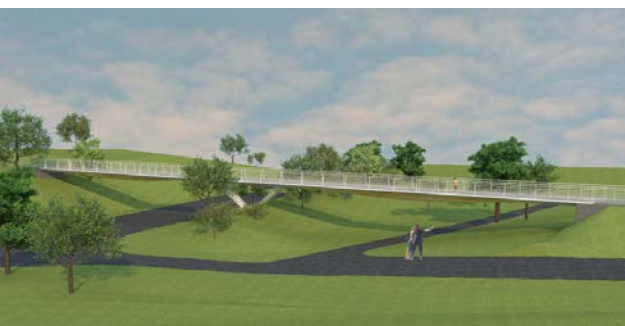
Visualisierung Steg, Büro Harrer Ingenieure

Die Querung über den Seeblickweg auf Höhe Zuckerbergstraße soll mit einer filigranen Holz-/Betonkonstruktion die Stadtteile Neugereut und Steinhaldenfeld verbinden. 2018 wurde das Projekt um die Straßen- und Verkehrsplanung Zuckerbergstraße ergänzt. Im Januar 2020 hat der Gemeinderat den Bau- und Vergabebeschluss gefasst. Die Realisierung ist 2020/21 geplant.