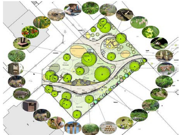
Entwurf Birke Hörner, Freie Landschaftsarchitektin

Im Rahmen der städtischen Initiativen „Bienenweiden in der Stadt“ und „Lass es blühen!“ sollen vermehrt auf öffentlichen Flächen die Lebensräume für Wildbienen und andere Insekten ausgeweitet werden. In diesem Kontext ist vorgesehen, auch die Grünfläche Seeadlerstraße am Wasserbehälter zu einem „Naturbeobachtungsraum“ umzugestalten.