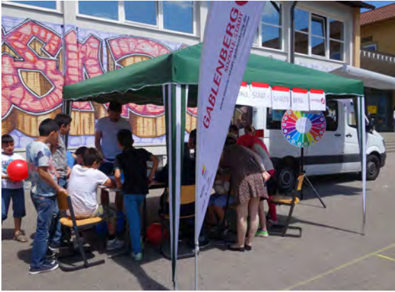
Rege Beteiligung bei der Befragungsaktion von Kindern und Jugendlichen auf dem Schulfest der GWRS Gablenberg

Inzwischen erscheint ebenfalls ein regelmäßiger Newsletter (ca. alle drei Monate), der über aktuelle Themen und Termine informiert.