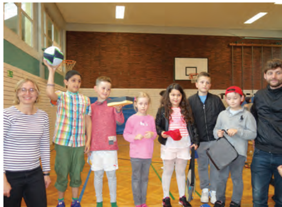
Preisverleihung beim Bewegungstag (l.) mit dem stolzen Siegern (r.)