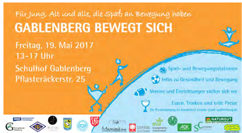
Flyer zum Bewegungstag am 19.05.2017

Das Ziel, Grünflächen mit Aufenthaltsqualität zu schaffen , wurde durch das Projekt "Urbanes Gärtnern Gablenberg" in der Bergstraße bereits angegangen (siehe unten). Die Idee der Aufwertung des Höhenwegs muss noch konkretisiert werden.