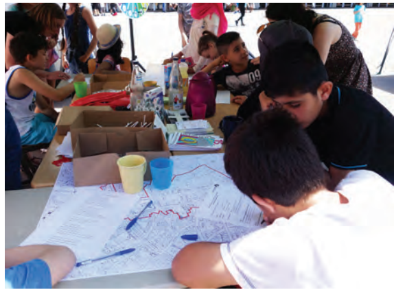
Befragungsaktion von Kindern und Jugendlichen auf dem Schulfest der Grund- und Werkrealschule Gablenberg, 09.07.2016