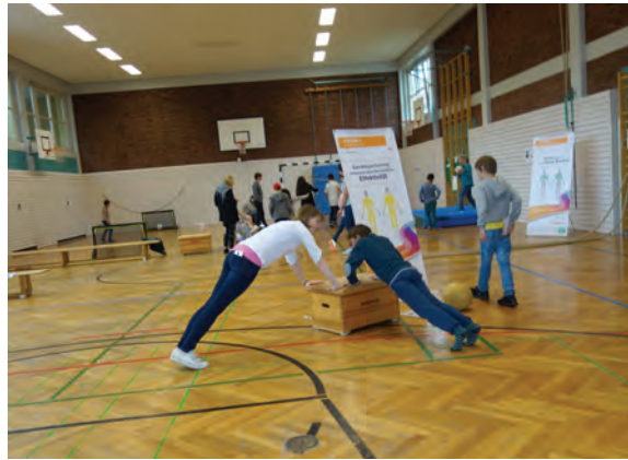
Leider Regen beim Bewegungstag "Gablenberg bewegt sich!" am 19.05.2017... dann wurde einfach in die Sporthalle ausgewichen.