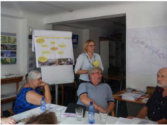
Planung der Mitglieder der PG Gablenberger Hauptstraße für das Kolloquium zum Wettbewerb

Der Gesamtraum Schule, die Spielplätze und das Karamba Basta am Schmalzmarkt dienen den Kindern und Jugendlichen als häufigster Aufenthaltsort im Stadtteil. Es fehlen demnach weitere Aufenthaltsorte und Freiräume. Das Thema Sport und Bewegung spielt laut der Befragung eine große Rolle für die Kinder und Jugendlichen – eine Mehrheit gibt an, gerne eine neue Sportart lernen zu wollen.