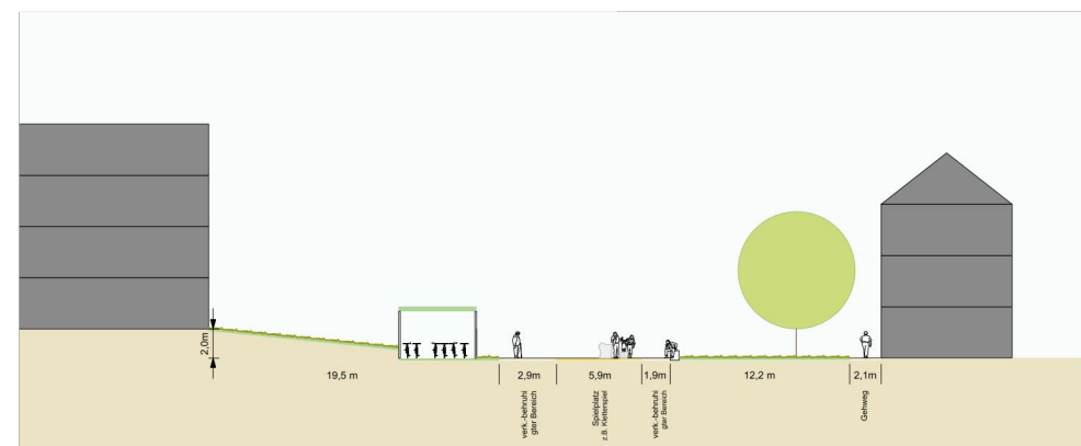
Schnitt 1 M 1:200