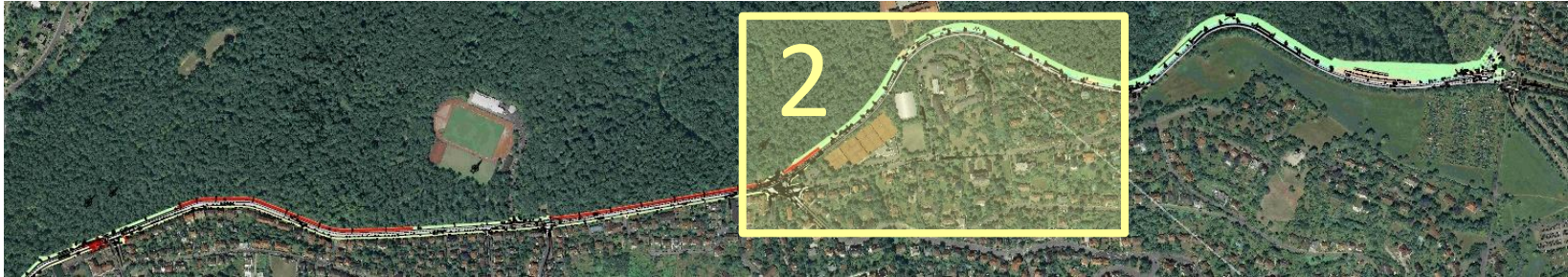
Regelquerschnitt RQ 4