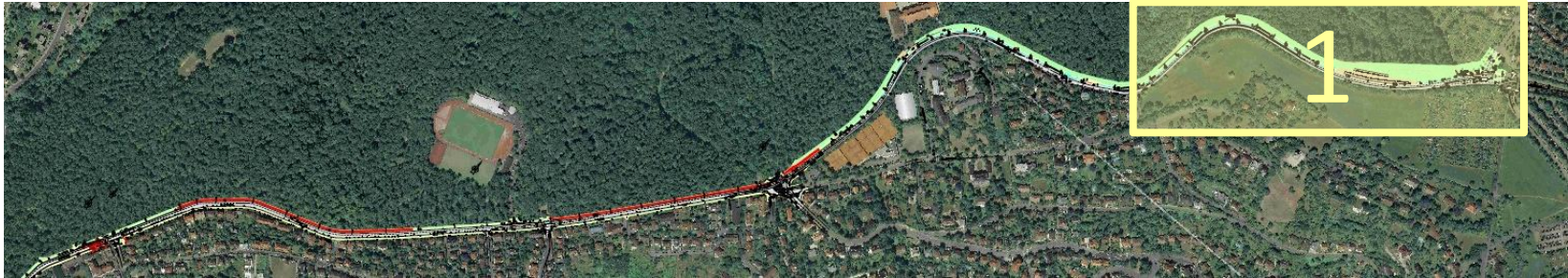
Regelquerschnitt RQ 1