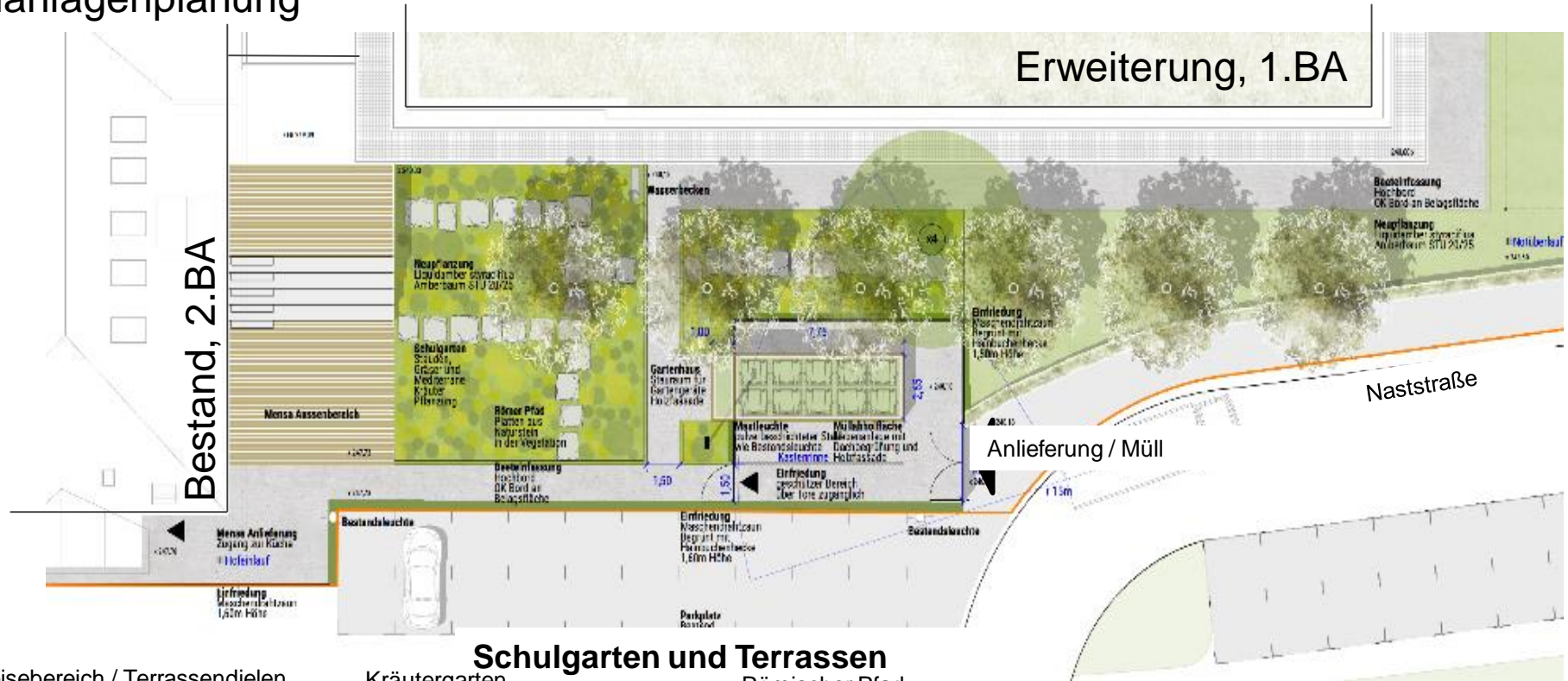
Speisebereich / Terrassendielen