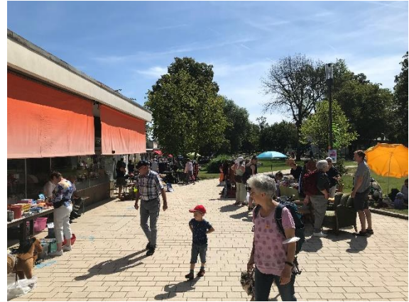
18.07.2022 Aktions-Nachmittag Eltern-Kind-Treff