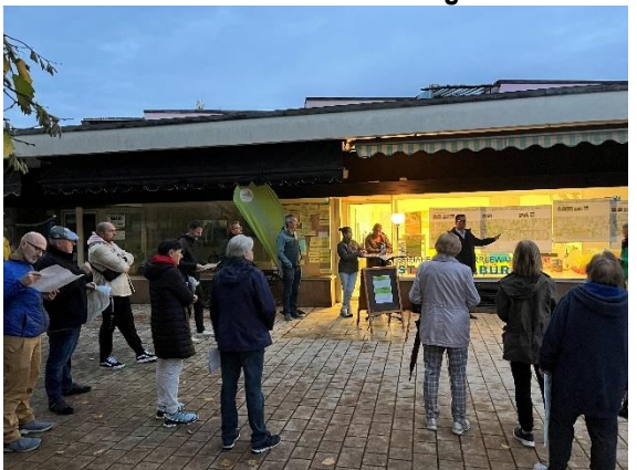
16.09.2022 Zwiebelkuchenfest 2022