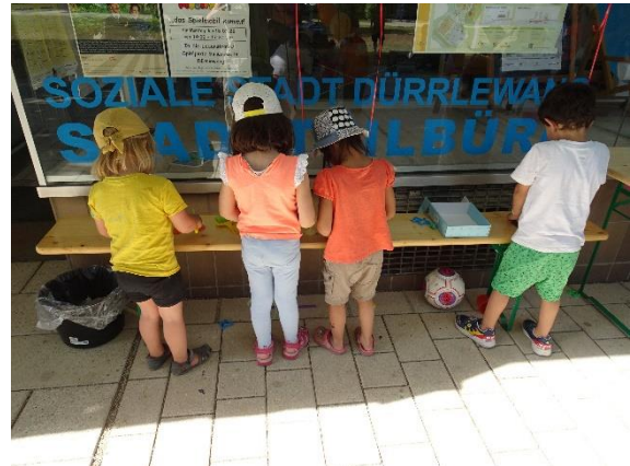
04.08.2022 1. Beteiligung zum Vorentwurf Mittelweg