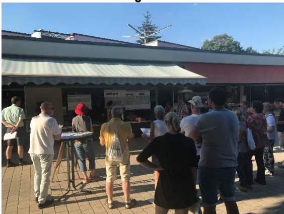
20.10.2022 2. Beteiligung zum überarbeiteten Vorentwurf Mittelweg