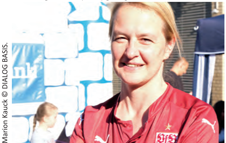
Marion Kauc © DIALOG BASIS.

Die AG Verkehr setzt sich seit längerem für eine Begrünung der Gleise in der Neckarstraße ein. Neben einer optischen Aufwertung spielen unter anderem auch ökologische und klimatologische Überlegungen eine wichtige Rolle. Im Versuch (Olgaeck und Wilhemsplatz) hat sich bewährt, wird vom Bezirksbeirat unterstützt und wurde im Bürgerhaushalt 2017 unter den Vorschlägen zu Stuttgart-Ost auf den 2. Platz gewählt. Wie eine Begrünung aussehen könnte, soll in einer Fotomontage-Aktion (2020) gezeigt werden.