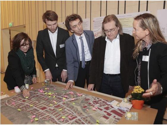
Auftaktveranstaltung im April 2016