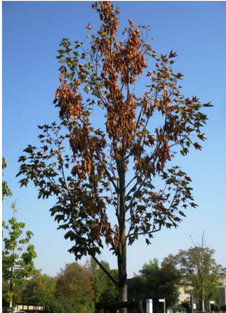
Landeshauptstadt Stuttgart – Garten-, Friedhofs- und Forstamt