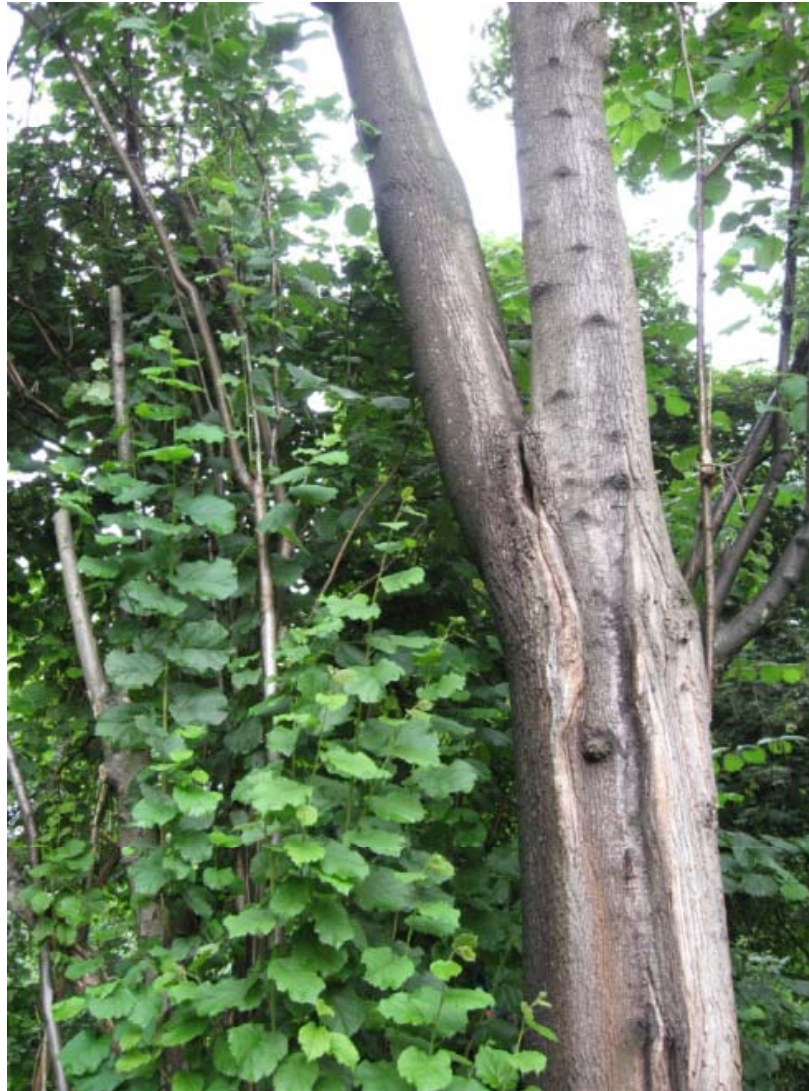
Landeshauptstadt Stuttgart – Garten-, Friedhofs- und Forstamt