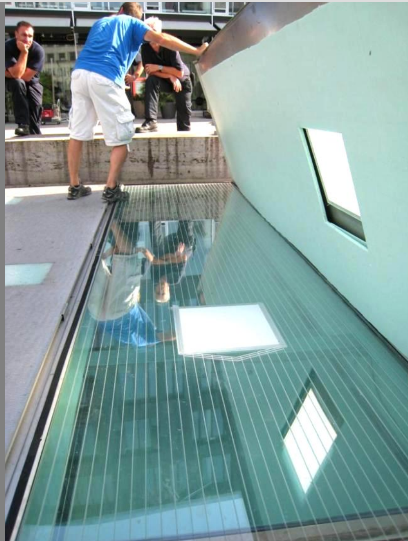
Sanierung Oberlichtband Kunstmuseum - Kleiner Schlossplatz 1 Einbau Edelstahlplatte mit Einlageplatten als Unterkonstruktion