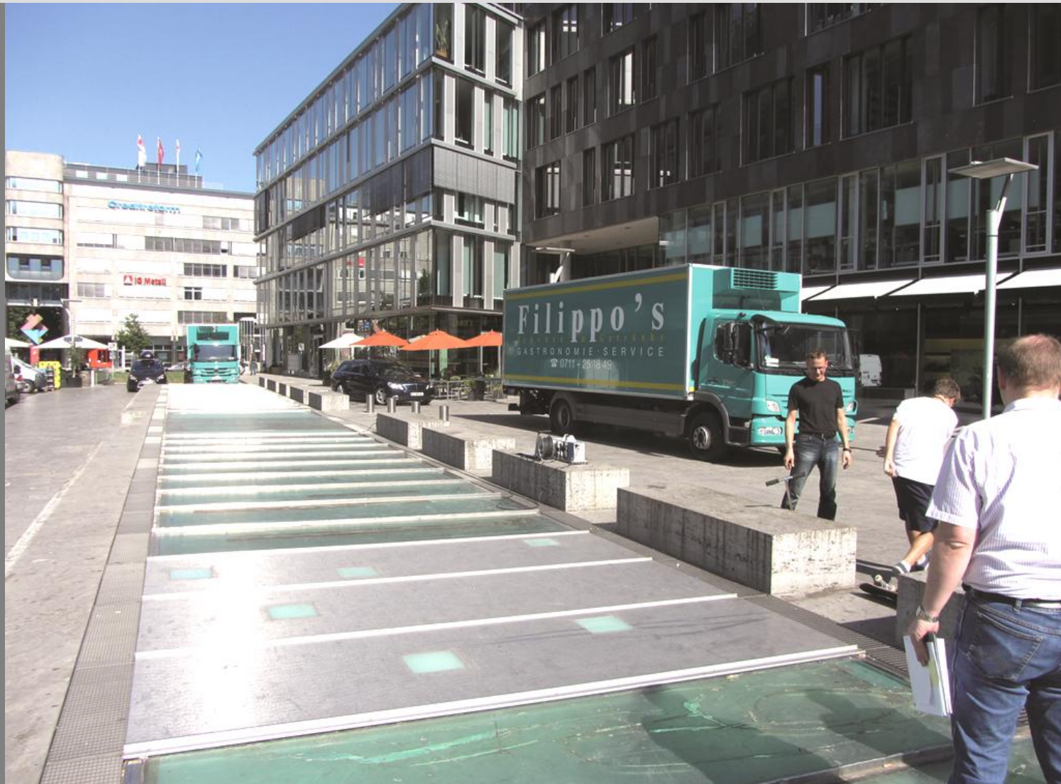
Sanierung Oberlichtband Kunstmuseum - Kleiner Schlossplatz 1 Einbau der 3 Musterplatten