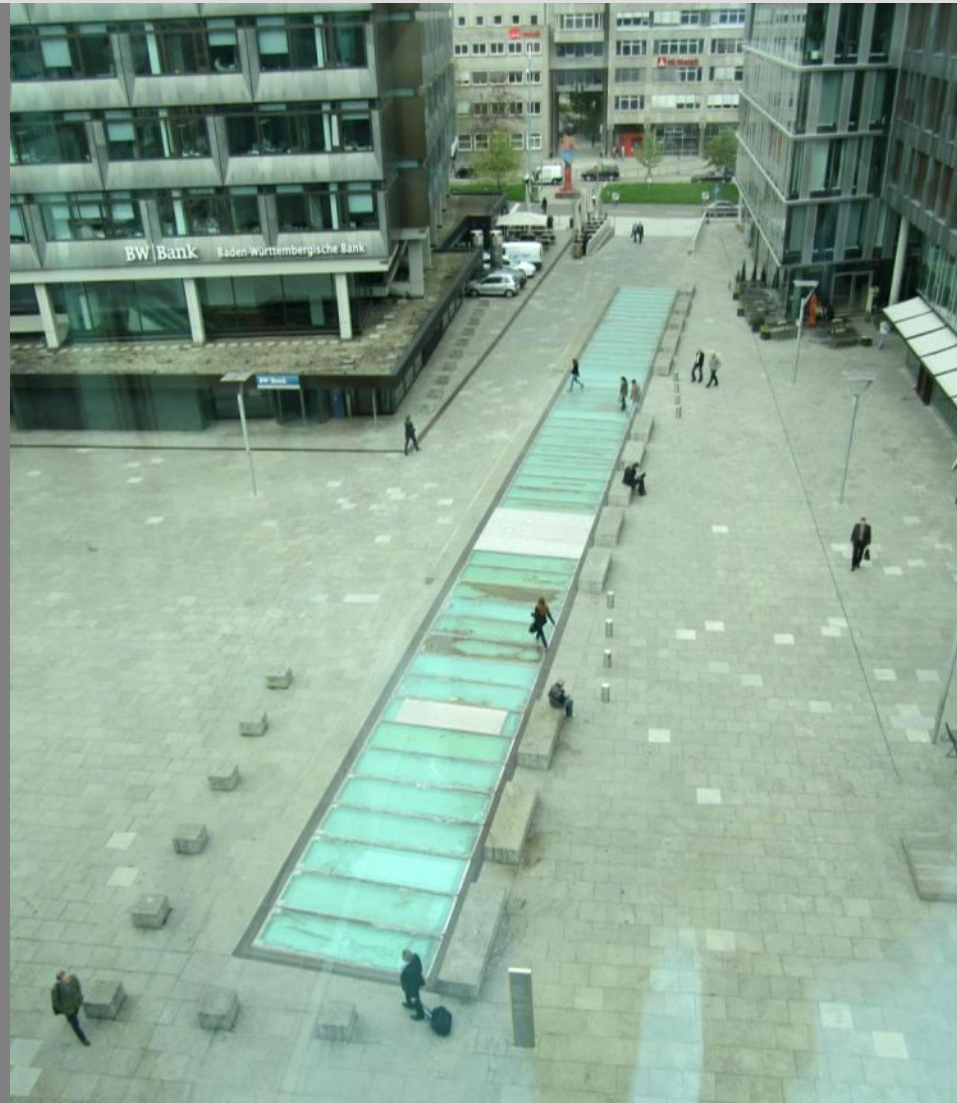
Sanierung Oberlichtband Kunstmuseum - Kleiner Schlossplatz 1 heutiger Zustand