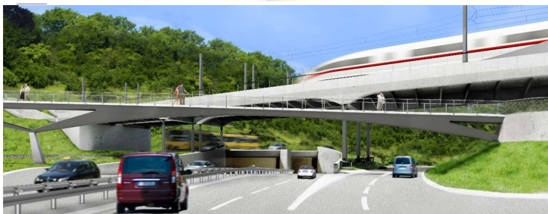
Abb. 3, 4: Ansicht und Visualisierung der geplanten Geh- und Radwegbrücke über die B 10 Neckartalstraße