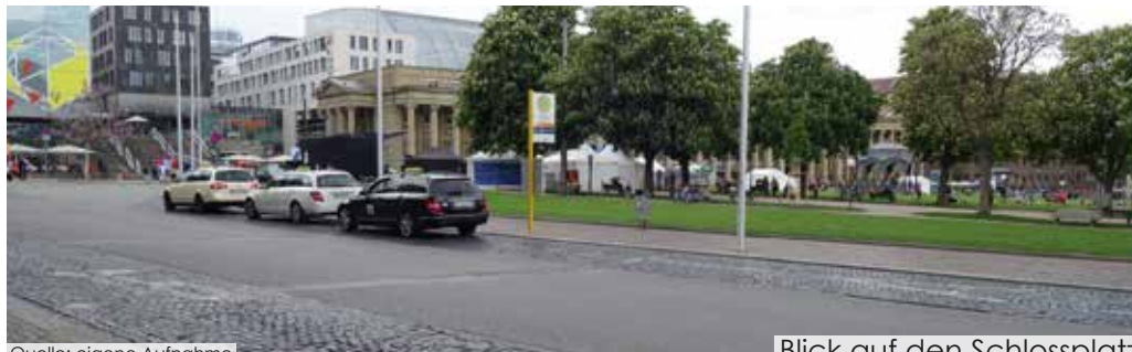
Blick auf den Schlossplatz