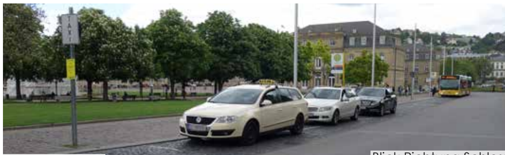
Blick Richtung Schloss