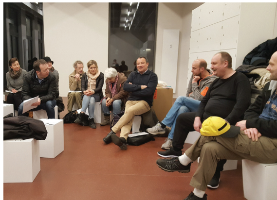
Gründungssitzung Bürgerverein "Bürgertreff Gablenberg e.V.", 30.03.2020