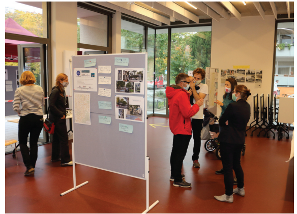
Beteiligung und Info zur Idee Klingenstrabe Fahrradstrabe 22.10.2020