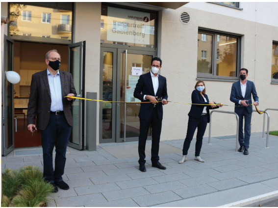
Offizielle Einweihung des neuen Bürgertreff Gablenberg am 21.10.2020

Ecke Klingen-/Wagenburgstraße) an die Mitglieder der Projektgruppe, die sich als neu gegründeter Bürgerverein " Bürgertreff Gablenberg e.V. ", um diesen kümmert. Aufgrund der Corona-Beschränkungen ist bis heute leider kein Publikumsverkehr zugelassen und die Nutzung des Bürgertreffs nicht vollumfänglich möglich. Der Bürgerverein kommuniziert mit den zukünftigen Nutzern der Räume, bearbeitet Raumanfragen, stimmt sich mit dem Haupt- und Personalamt als Mieter der Räume ab, erstellt eine eigene Homepage und Flyer.