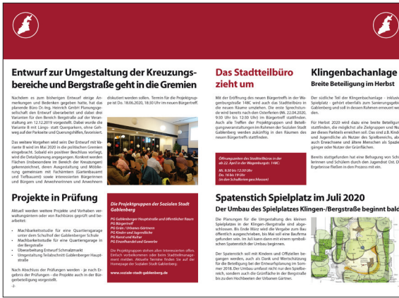
Newsletter vom Frühjahr 2020