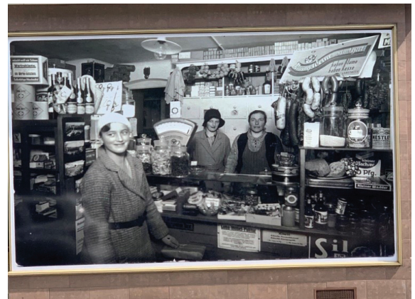
Verfügungsfonds-Projekt "Beklebung Schaufenster in der Gablenberger Hauptstrabe"