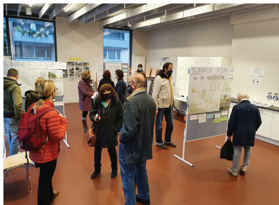
Beteiligung zur Gablenberger Hauptstraße, 15.10.2020