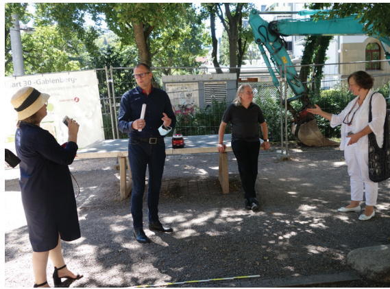
Spatenstich zum Baustart Spielplatz Berg-/Klingenstraße, 30.07.2020