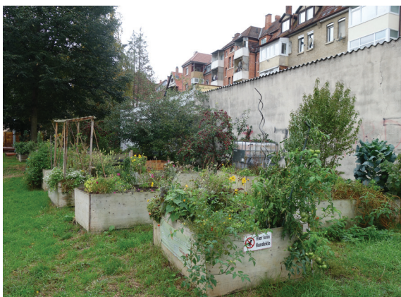
Die Beete der Urbanen-Garten-Kolonie in der Bergstraße