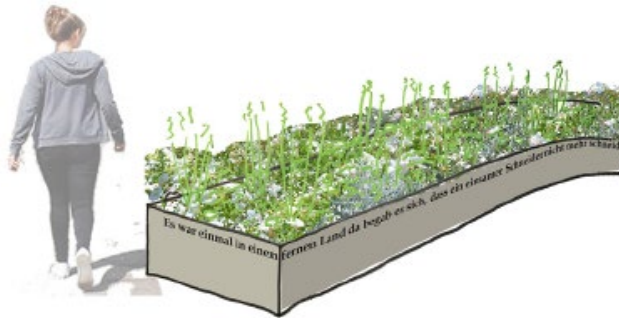
Visualisierung Hochbeet, Sophia Hartwig Landschaftsarchitektur

Der Entwurfstand wurde im Mai und Juni 2021 mit den Bürger*innen im Stadtteil und im Bezirksbeirat Mühlhausen abgestimmt. Coronabedingt musste die Bürgerbeteiligung in einem internettauglichen Videoformat durchgeführt werden. Zuvor wurde die Planung vom 17. Mai bis zum 11. Juni 2021 im Schaufenster der Bibliothek ausgestellt. Am 16. Juni 2021 wurde den interessierten Bürger*innen der Entwurfsstand in einer abendlichen Videokonferenz, am 29. Juni im Bezirksbeirat Mühlhausen, vorgestellt und abgestimmt.