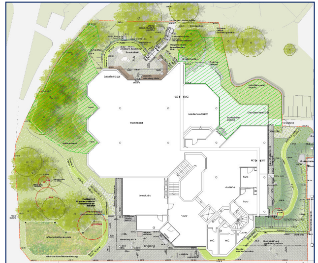
Entwurf Aufwertung Freianlagen Stadtteilbibliothek, Sophia Hartwig, Landschaftsarchitektur

Nach fast 40 Jahren Betriebszeit sind die Außenanlagen der Stadtteilbibliothek in die Jahre gekommen. Insbesondere der Lesegarten entspricht nicht mehr den Bedürfnissen der Nutzer.