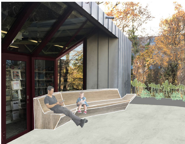
Visualisierung Lese-Sofa, Sophia Hartwig Landschaftsarchitektur

Die Realisierung der Maßnahme ist im 1. Halbjahr 2022 vorgesehen.