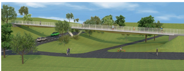
Visualisierung Steg, Büro Harrer Ingenieure

Die Querung mit einem Geh- und Radweg über den Seeblickweg auf Höhe der Zuckerbergstraße soll mit einer filigranen Holz-/Betonkonstruktion die Stadtteile Neugereut und Steinhaldenfeld verbinden und auch die Erreichbarkeit des Ferienwaldheims Steinhaldenfeld über den Seeblickweg verbessern. 2018 wurde das Projekt um den Gehweganschluss und um den Ausbau der Verkehrsflächen in der Zuckerbergstraße ergänzt.