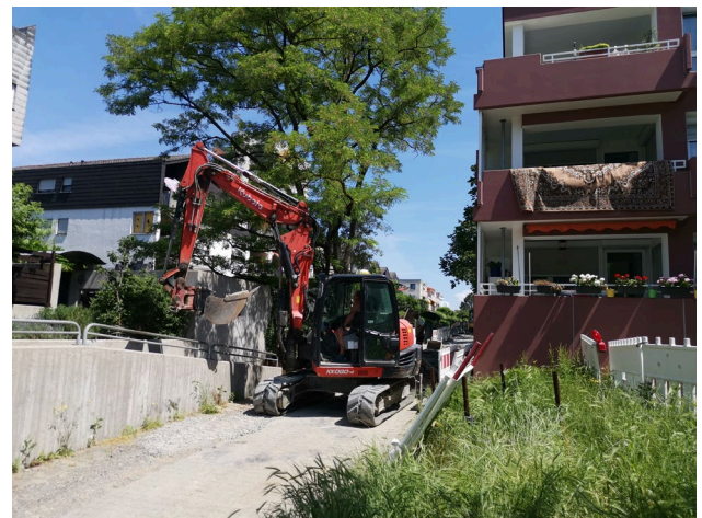
Baustelle Mai 2021 Bauabschnitt Schule-Schneideräckerstraße

Die Aufwertung des Inneren Wegenetzes ist seit 2012 ein weiteres wichtiges Leitprojekt der Sozialen Stadt Neugereut. Das Gestaltungskonzept des Büros Planstatt Senner Landschaftsarchitektur kann man mit drei Schlagworten umreißen: