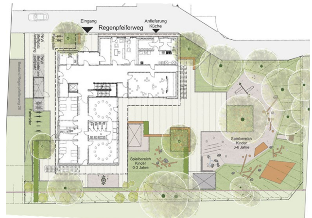
Kita Regenpfeifer, Neubau Erdgeschossnutzung Entwurf: Günter Hermann Architekten, Stuttgart

Das 1-stöckige Bestandsgebäude ist in einem schlechten baulichen Zustand, genügt nicht mehr den aktuellen Anforderungen und soll durch einen Neubau ersetzt werden.