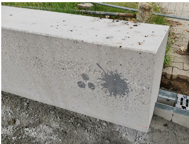
Intarsienstein mit Baumhaselfrucht

Die bestehenden Bäume geben den Plätzen ihre Eigenart. Die Plätze werden den Baumarten zugeordnet und erhalten somit eine eigene Adressen (Lindenplatz, Baumhaselplatz, etc.). Das Thema der Bäume findet sich in den Belagsflächen und in den Sitzelementen wieder. Hierfür werden Baumblattsymbole, Namen oder Früchte in die Betonelemente und Plattenbeläge als Intarsie eingelassen und verweisen so auf die entsprechende Baumart.