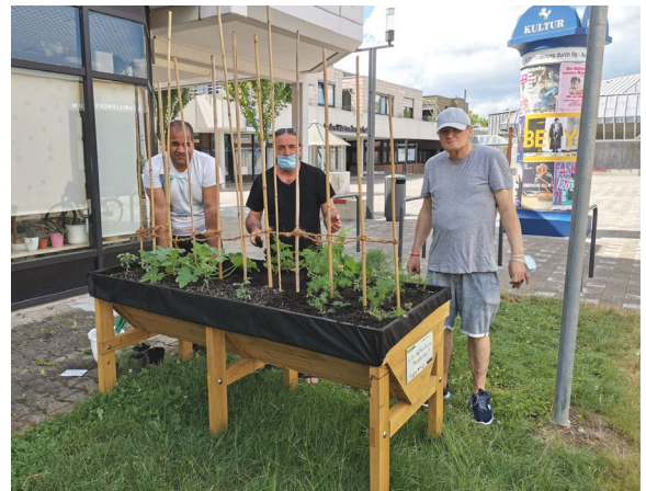
Hochbeet am BIWAQ-Büro, die Gartenwarte

nachhaltiger machen. Als erster Schritt wurde in Kooperation mit dem BIN, dem Stadtteil- und Familienzentrum Neugereut, dem Kinder- und Jugendhaus JimPazzo, dem Haus St. Monika und der Mobilen Jugendarbeit Neu-Stein-Hofen an zwei Standorten - auf der Bistrotterasse, Flamingoweg 24 und auf der Wiese neben dem BIWAQ-Projektbüro, Marabustrasse 35 - jeweils ein Hochbeet mit Gemüse- und Kräuterpflanzen aufgestellt und bepflanzt.