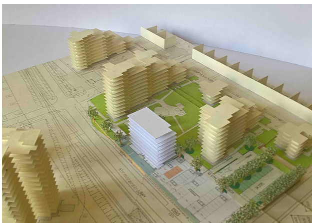
Modell Neubau Pelikanstraße, Foto Veronika Nemeth

Die Baugenossenschaft Friedenau der Straßenbahner e.G. möchte auf ihrem Grundstück Pelikanstraße 3 - 19 einen Neubau mit 30 WE errichten, und damit ihren Wohnungsbestand an der Pelikanstraße ergänzen.