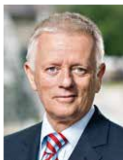
Fritz Kuhn Oberbürgermeister, Landeshauptstadt Stuttgart

Stuttgart und die Region sind reich an Natur, Wirtschafts- und kultureller Anziehungskraft. Doch gerade diese Attraktivität stellt uns heute vor enorme Herausforderungen. Mobilität, bezahlbarer Wohnraum und die Sicherung von Naturräumen und Wirtschaftskraft erfordern ständig kreative Lösungen. 100 Jahre nach der Ausstellung des Deutschen Werkbunds mit der Weißenhofsiedlung hätten wir mit einer Internationalen Bauausstellung 2017 die Möglichkeit, nach gemeinsamen Lösungen für unsere Region zu suchen.