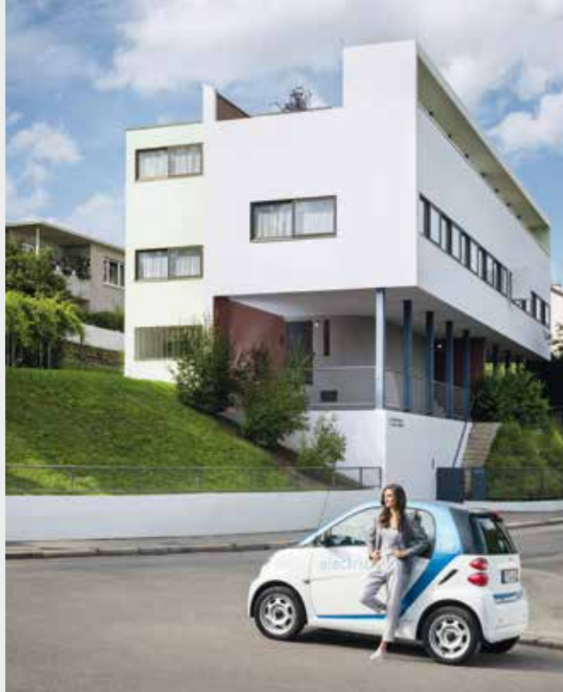
Wirtschaftsförderung Region Stuttgart GmbH (WRS)/Detlef Gökeleritz. Dieses Foto ist urheberrechtlich geschützt und darf nicht verbreitet oder vervielfältigt werden.