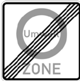
Abbildung 13: Beschilderung des Endes der Umweltzone (Zeichen 270.2 StVO)