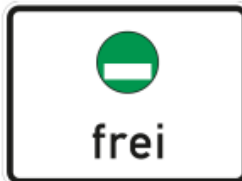
Abbildung 14: Zusatzzeichen 1

Das Zusatzzeichen zum Zeichen 270.1 StVO nimmt Fahrzeuge vom Verkehrsverbot aus, die mit einer grünen Plakette nach § 3 der 35. BImSchV ausgestattet sind.