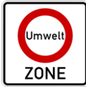
Abbildung 12: Beschilderung der Umweltzone (Zeichen 270.1 StVO)