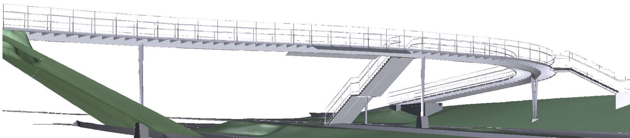
Abb. 4: 3D Modell