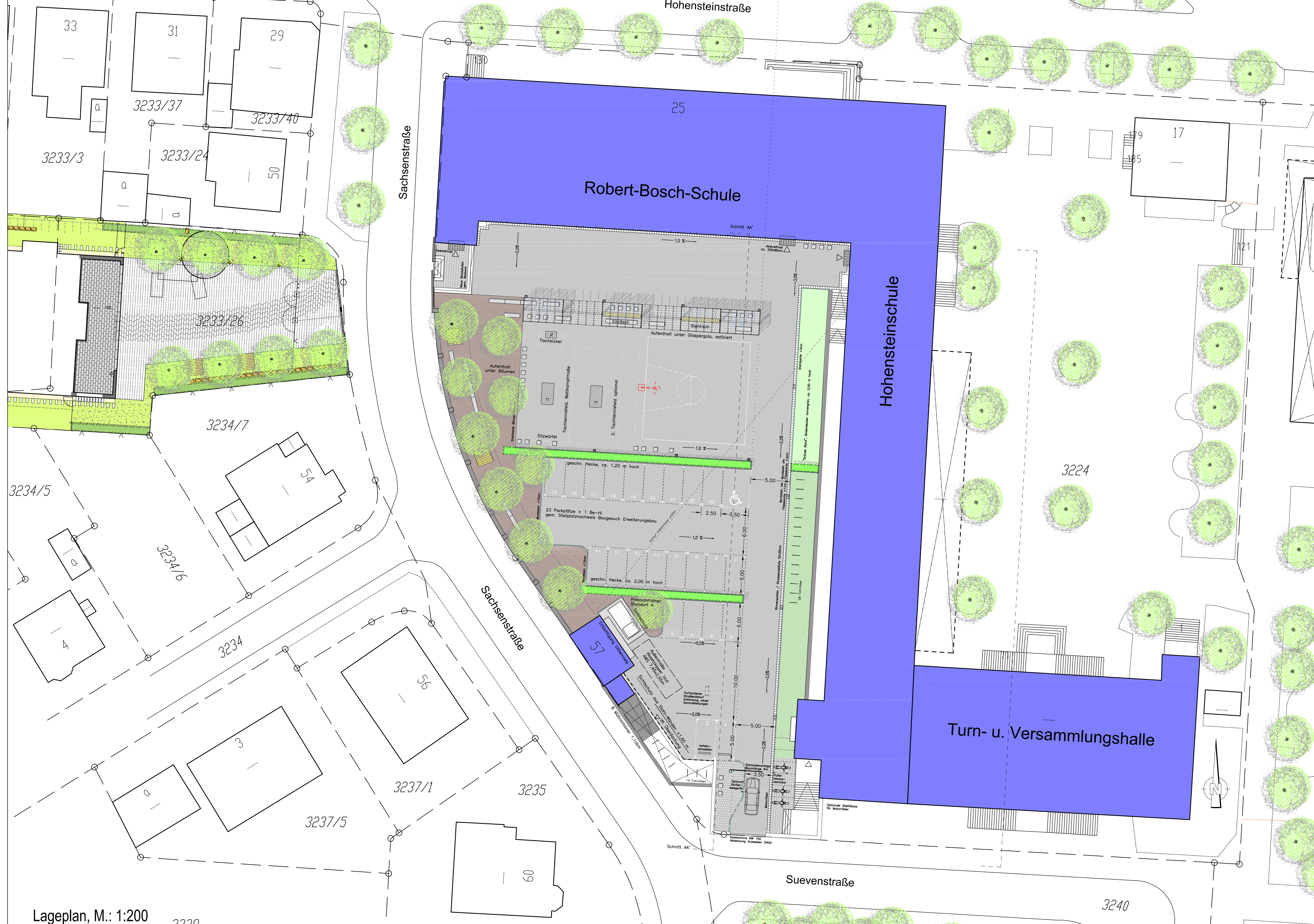
Lageplan, M.: 1:200