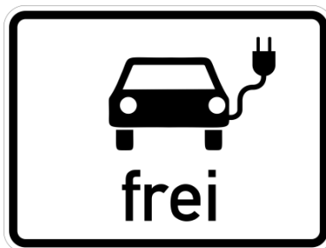
Abbildung 2: Zusatzzeichen „Elektrofahrzeuge frei“ (Zeichen 1024-20 StVO)

Im Zulauf auf die Kreuzung Am Neckartor / Neckarstraße führt der rechte Fahrstreifen auf der Willy-Brandt-Straße (B14) als reiner Rechtsabbiegerfahrstreifen in die Neckarstraße. Diesen Rechtsabbiegerfahrstreifen dürfen Busse nutzen, um geradeaus über die Kreuzung Am Neckartor / Neckarstraße auf den sich fortsetzenden Busfahrstreifen zu gelangen. Die Länge des Rechtsabbiegerfahrstreifens soll mindestens 60 m betragen. Die Länge des Busfahrstreifens auf der Straße Willy-Brandt-Straße vom „Wulle-Steg“ bis zum Beginn des Fahrstreifens für Rechtsabbieger soll mindestens 150 m betragen.