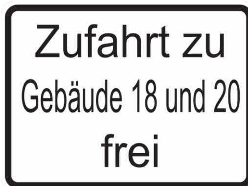
Abbildung 6: Zusatzzeichen „Zufahrt zu Gebäude 18 und 20 frei“