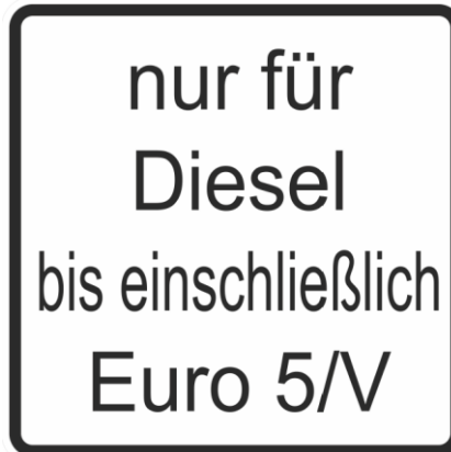
Abbildung 5: Zusatzzeichen