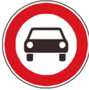
Abbildung 4: Verbot für Kraftwagen (Zeichen 251 StVO)

Strecke als Wechselzeichen an Feinstaubalarmtagen gekennzeichnet. Das Zusatzzeichen wird mit Zustimmung der obersten Straßenverkehrsbehörde auf der Grundlage der VwV-StVO Rn. 46 zu §§ 39-43 eingeführt. Von dem Verkehrsverbot werden Anlieger der Wohngebäude an diesem Streckenzug durch das Zusatzzeichen „Zufahrt zu Gebäude 18 und 20 frei“ ausgenommen.