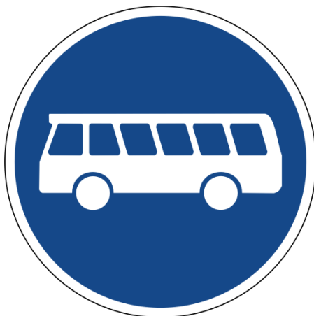
Abbildung 1: Bussonderfahrstreifen (Zeichen 245 StVO)

Die Beschilderung des Busfahrstreifens erfolgt mit Zeichen 245 StVO „Bussonderfahrstreifen“ in Kombination mit dem Zusatzzeichen 1024-20 „Elektrofahrzeuge frei“ der laufenden Nummer 25.1 der Anlage 2 zu § 41 Absatz 1 StVO.