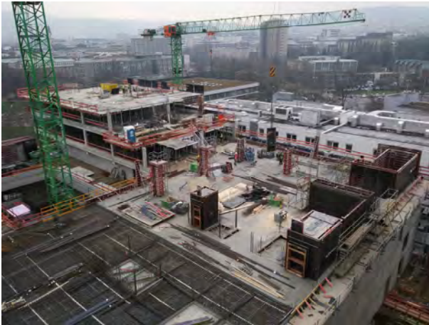
Rohbauarbeiten – Decke über E4 begonnen