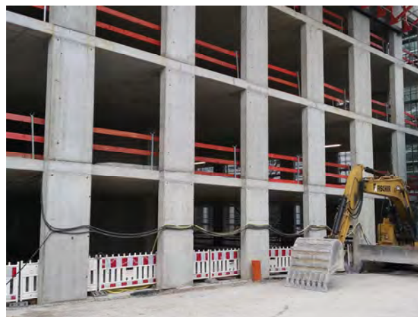
Rohbauarbeiten – Ansicht West