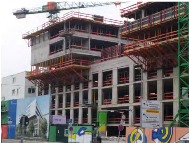
Rohbauarbeiten – Ansicht Süd/Kriegsbergstraße