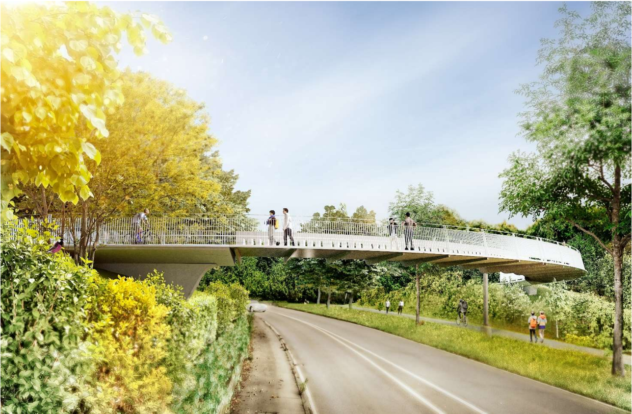
Abb.1: Visualisierung der geplanten Geh- und Radwegbrücke über die Ludwigsburger Straße in nördl. Blickrichtung